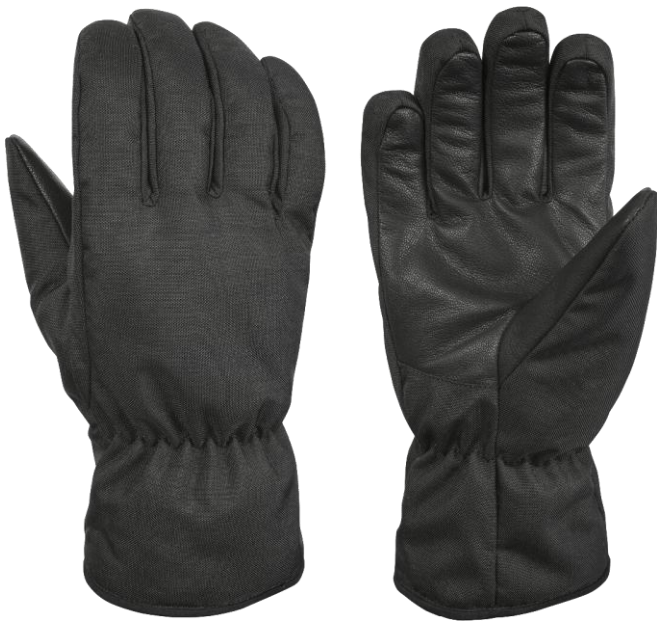
EMILY POLICE Gauntlet Black

Kolekce speciálních rukavic pro policii a bezpečnostní agentury.